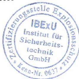
- Siegel - (Kenn-Nr. 0637)