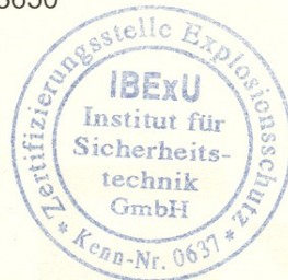
Siegel (Kenn-Nr. 0637)