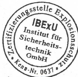
- Siegel - (Kenn-Nr. 0637)