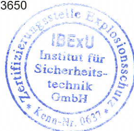
Siegel (Kenn-Nr. 0637)